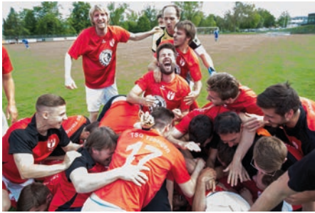
Unbändige Freude nach dem Auswärtssieg beim FC Rottenburg, der die Meisterschaft in der Landesliga bedeutete.

ben wir schon wahnsinnig viel erreicht.“ Aus einem nicht verlorenen Spiel wurden viele Siege, viele besondere Momente – und am Ende neun Jahre in der höchsten Spielklasse des Württembergischen Fußballverbandes.