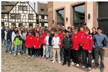
TSG Tübingen C2 – Meister der Leistungsstaffel.