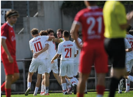
Auch im Abstiegsjahr gab es Grund zum Jubeln. Besonders bei den beiden Derbysiegen gegen den FC Rottenburg.