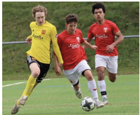
Mit vereinten Kräften zum Derbysieg gegen den SV 03 Tübingen.

Besonders wichtig ist die Zweite Mann- schaft für die strategische Ausrichtung unserer Fußballabteilung. Sie bildet die zentrale Brücke zwischen Jugend- und Aktivenbereich. Gerade der Übergang aus der A-Jugend in den aktiven Fußball ist anspruchsvoll, da der Unterschied zwi- schen Jugendfußball und dem körperbe- tonten Erwachsenenbereich in der Be- zirksliga enorm ist. Umso wichtiger ist es, jungen Spielern die Möglichkeit zu geben, sich Schritt für Schritt an dieses Niveau zu gewöhnen und weiterzuentwickeln.