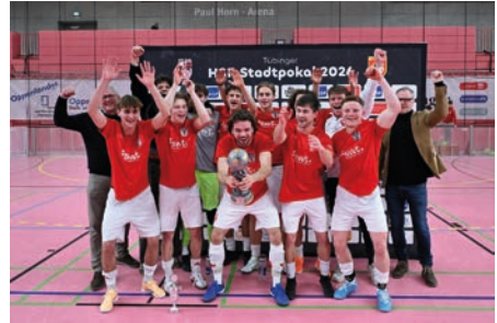
Hier jubelt unsere Erste Mannschaft über den Titelgewinn 2026. Im kommenden Jahr wollen wir uns auch als Ausrichter so erfolgreich zeigen.

Eine Veranstaltung dieser Größenordnung kann nur gemeinsam gestemmt werden. Wir haben bereits eine Projektgruppe gegründet, um die Organisation voranzutreiben. Dabei wurden einzelne Ressorts gegründet und die Aufgaben verteilt. Um diese erfüllen zu können, sind wir auf viele Helferinnen und Helfer angewiesen. Unterstützung benötigen wir insbesondere in den Bereichen Auf- und Abbau, Bewirtung sowie in der Turnierleitung.