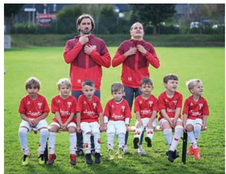
So sehen die Vorbereitungen für das erste professionelle Fotoshooting aus.

Gleichzeitig ist der Medientag aber weit mehr als nur ein Fototermin. Er ist auch ein gemeinsamer Auftakt in die neue Saison, ein erstes Zusammenkommen vieler Mannschaften und ein wichtiges „Stell-dich-ein“ innerhalb der Fußballabteilung. Spielerinnen und Spieler, Trainerteams und Verantwortliche kommen zusammen und stimmen sich gemeinsam auf die kommende Spielzeit ein.