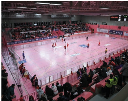
Volle Hütte beim Tübinger HSP Stadtpokal.

Der Stadtpokal ist weit mehr als ein Hallenturnier. Er ist ein Fußballfest für den gesamten Tübinger Fußball und eine Bühne, auf der sich die Vereine, Mannschaften und Spieler den Fußballbegeisterten der Stadt und der Öffentlichkeit präsentieren können. Als Gastgeber wollen wir dieses Turnier mit großem Engagement organisieren und zu einem besonderen Erlebnis für Spieler, Zuschauer, Vereine und Gäste machen. Der Stadtpokal bietet der TSG Tübingen die große Chance, die Fußballabteilung positiv nach außen zu präsentieren und sich als starken Player zu positionieren.